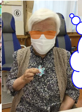
お花のブローチも素敵ですね！