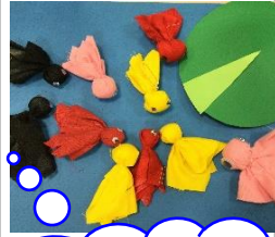
次回のレク大会は金魚すくいです☆

新田デイ月1のレク大会は「昆虫採取ゲーム」を開催！幼少時代を懐かしみながらも白熱した勝負となり、大変盛り上がりました。皆さん高得点を狙って頑張りました😊次回は製作レクに参加して頂いた利用者様に手伝ってもらった金魚を使い、楽しいゲーム大会を企画しています。お楽しみに！！（新田デイ・高橋）